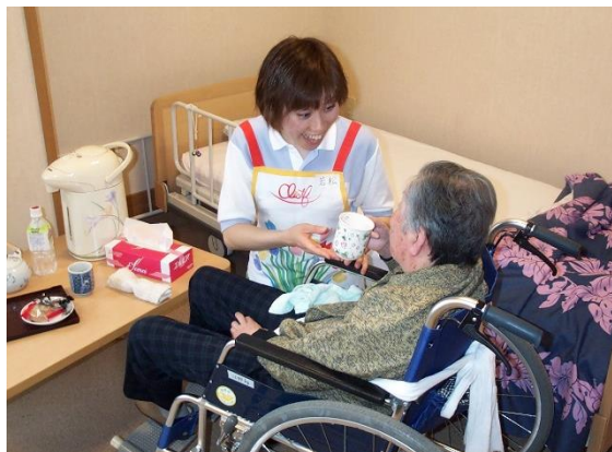
〔 食事介護 〕