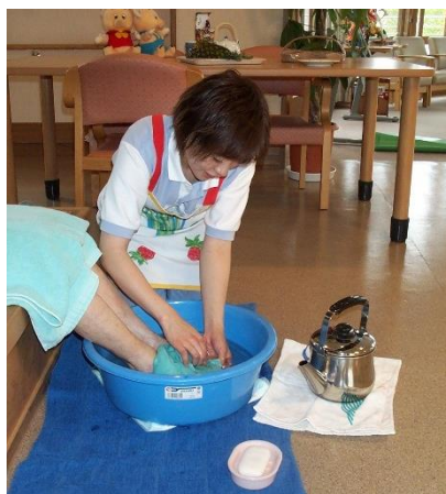
〔 足浴介護 〕