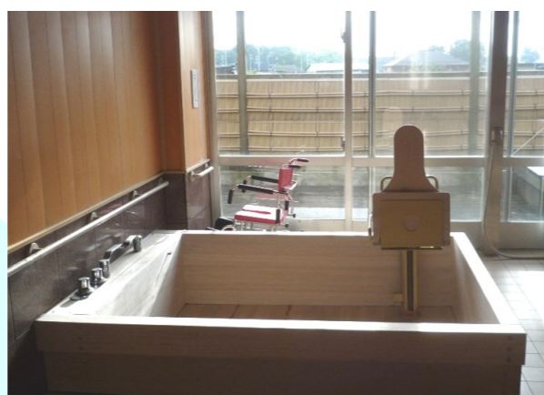
香りゆたかな檜風呂