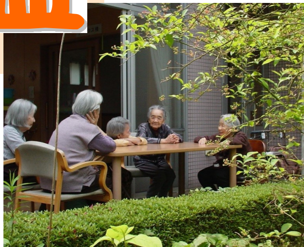
四季折々の花が咲く中庭